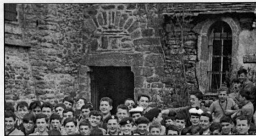
Détail du portail