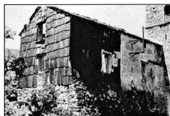
Le presbytère de Douch.

niveau du clocher ainsi que des linteaux cintrés des quatre fenêtres éclairant la chambre des cloches. La voûte de la nef laisse voir d'importantes traces d'humidité, qu'explique un certain désordre des lauzes de couverture. Des travaux de réhabilitation nous paraissent revêtir une certaine urgence ☐