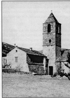
Le clocher-porche (Photo G. Massol - 1955)

Note : La démolition de l'avant et de son mur d'appui latéral a reçu l'avis favorable de l'architecte des Bâtiments de France, M. Alain Vernet ; 19 juin 2000).